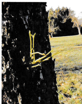
Austrieb aus Stamm