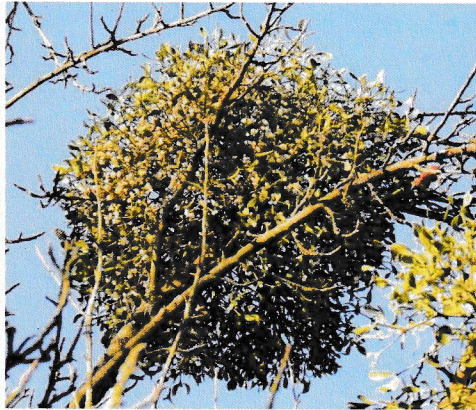
Mistel mit Früchten