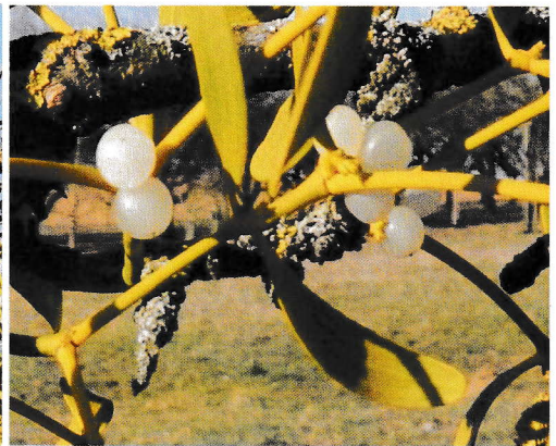
Früchte der Mistel