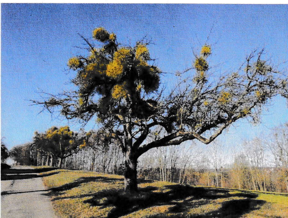
stark befallene Bäume